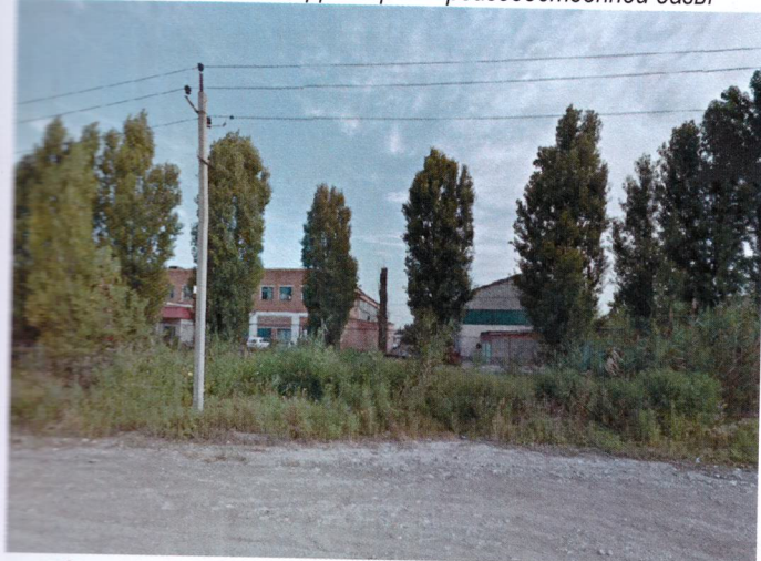
Фото 3. Производственный корпус и склад оборотных агрегатов