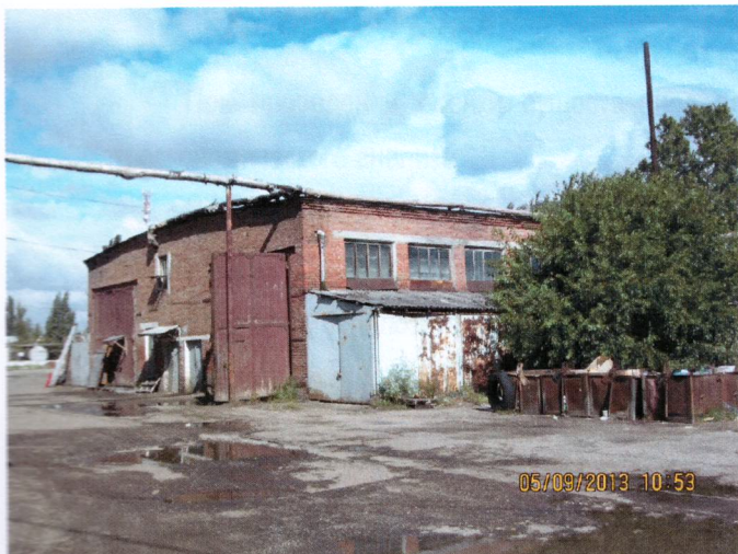
Фото 7. Территория базы