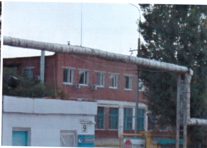
Фото 2. Производственный корпус