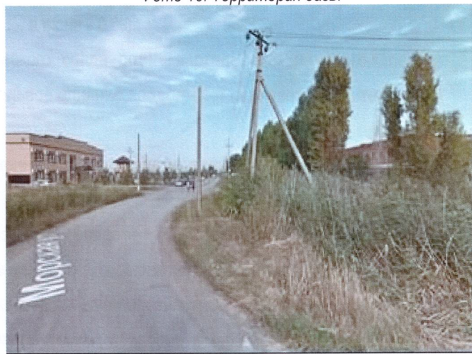
Фото 12. Окружение