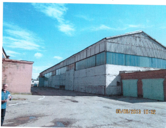
Фото 6. Склад оборотных агрегатов