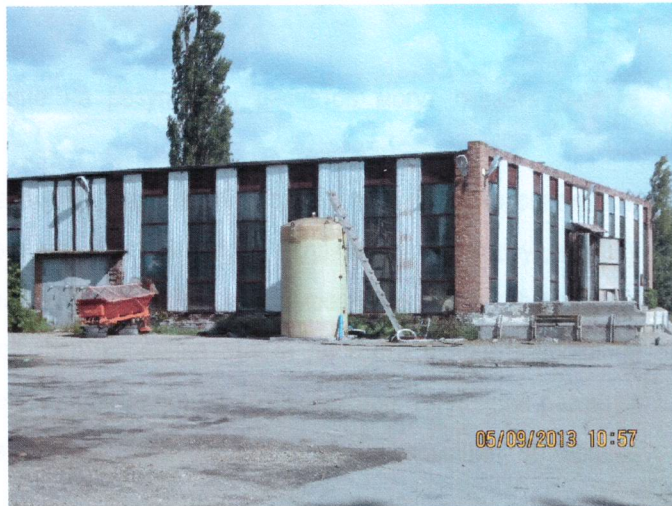
Фото 8. Территория базы