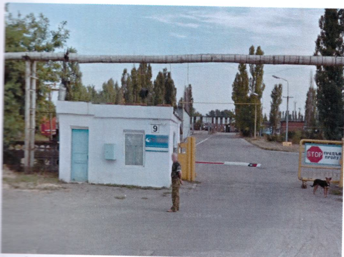
Фото 1. Въезд на территорию производственной базы