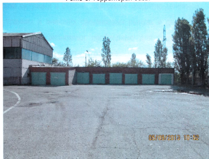
Фото 10. Территория базы