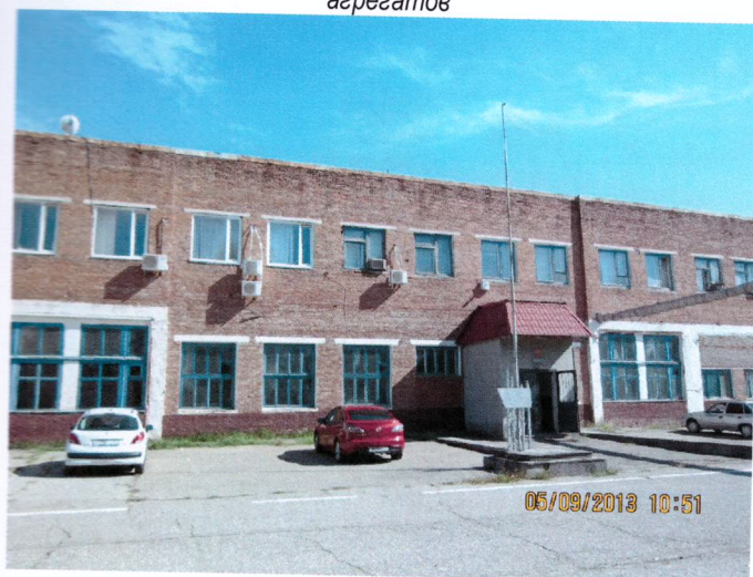
Фото 5. Производственный корпус